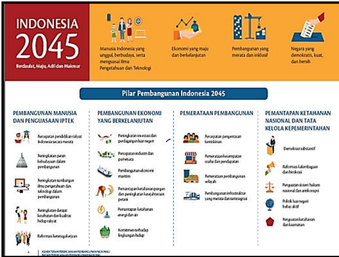
Gambar 1. Pilar Pembangunan Indonesia 2045

Salah satu Pilar Pembangunan Indonesia 2045 adalah peningkatan sumbangan ilmu pengetahuan dan teknologi dalam pembangunan berupa peningkatan ekspor produk berteknologi inovasi menengah-tinggi. Saat ini ekspor Indonesia terdiri dari migas dan non-migas yang mana sebagian besar didominasi non migas.