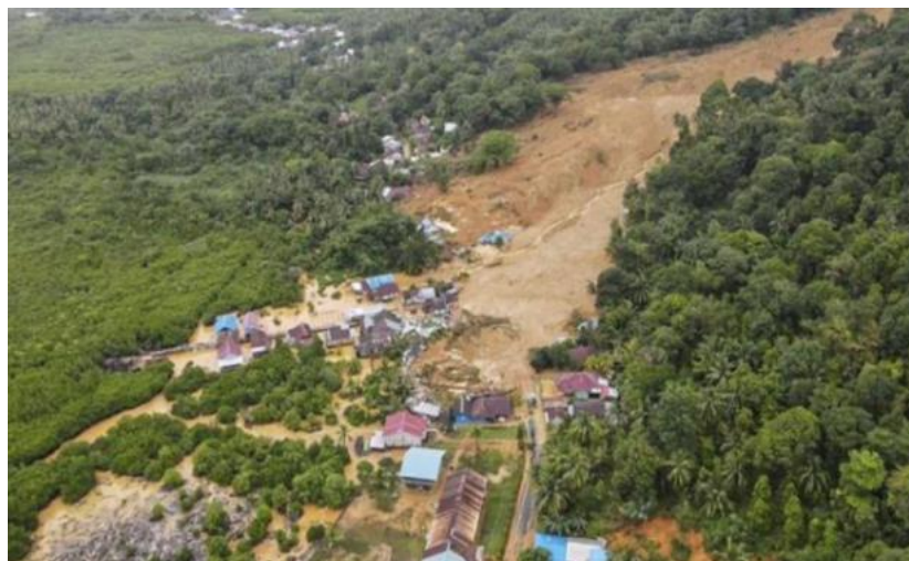
Gambar 2. Kondisi Pasca Tanah Longsor

Bencana tanah longsor juga mengakibatkan hilang dan rusaknya dokumen pribadi masyarakat. Dokumen yang dimaksud adalah KTP, KK, Ijazah, Surat Kepemilikan Tanah, BPKB, dan dokumen penting lainnya. Pemulihan kepemilikan dokumen pribadi telah dilakukan oleh sebagian masyarakat yang terdampak bencana, dan sebagian yang lainnya belum melakukan.