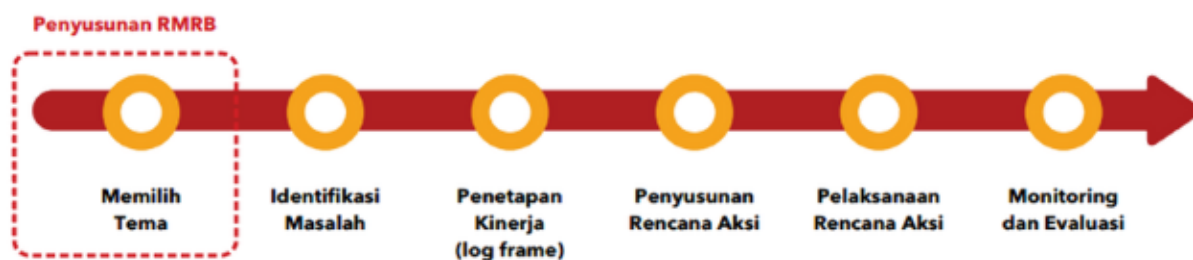
Gambar 4. Tahapan RB Tematik