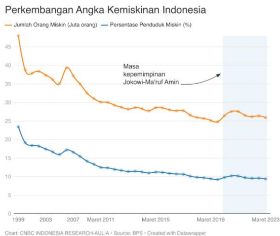
Gambar 1 Angka Kemiskinan di Indonesia

Undang-Undang Dasar tahun 1945 telah mengamanatkan bahwa tujuan berbangsa kita adalah melindungi segenap bangsa Indonesia dan seluruh tumpah darah Indonesia, memajukan kesejahteraan umum, mencerdaskan kehidupan bangsa, dan ikut melaksanakan ketertiban dunia. Dari tujuan memajukan kesejahteraan umum, salah satu isu yang sering mengemuka adalah masalah kemiskinan. Setelah 78 tahun Indonesia merdeka, kemiskinan masih menjadi masalah yang belum dapat dituntaskan.