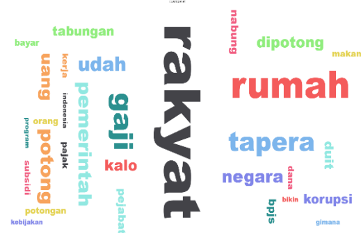
Gambar 2. Hasil analisis sentimen warganet terhadap kebijakan Tapera.

Data pada tabel tersebut menunjukkan bahwa hanya ada 19.116 data yang memenuhi syarat untuk dilakukan analisis sentimen melalui aplikasi Rapidminer. Berdasarkan hasil tersebut juga dapat diketahui bahwa banyak netizen yang memberikan sentimen negatif terhadap kebijakan Tapera yakni sebesar 16.171 komentar (85%). Sedangkan warganet yang memberikan sentimen positif sebanyak 2.945 komentar (15%).