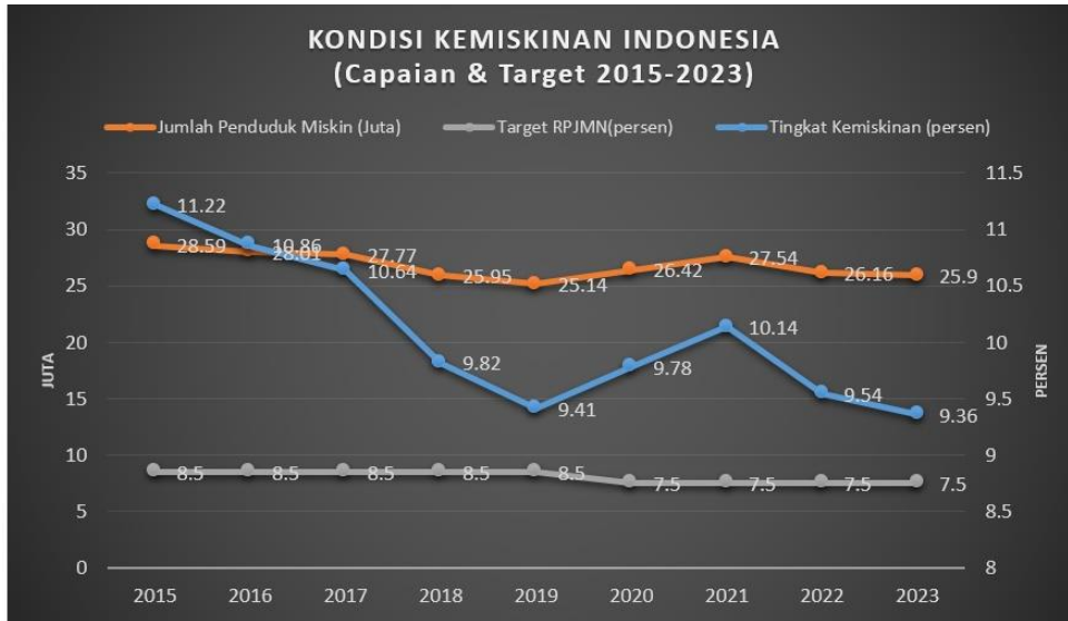
Gambar 1. Angka Kemiskinan Nasional, Sumber: BPS,2023.

selayaknya pemerintah mampu membuat kebijakan khusus yang mampu mengakselerasi program dan kegiatan pengentasan kemiskinan untuk dapat memenuhi target yang ditetapkan sebesar 7,5% pada tahun 2024.