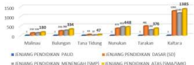
Data Anak Tidak Sekolah - Drop Out Berdasarkan Wilayah Individu Peserta Didik

Berdasarkan data Regsosek tahun 2022 diatas yang diakses melalui Aplikasi SEPAKAT (Sistem Perencanaan Pembangunan Berbasis Data Regsosek Terpadu) menunjukkan bahwa jumlah ATS usia 16-18 tahun memiliki proporsi 2,7 kali lipat lebih besar dibanding ATS usia 7-12 tahun. Apabila ditotal jumlah ATS usia 16-18 Tahun yang menjadi kewenangan Provinsi Kalimantan Utara berjumlah 8.466 ribu anak yang belum jelas diketahui penyebab serta faktor yang mempengaruhi sehingga anak tersebut berstatus menjadi anak tidak sekolah.