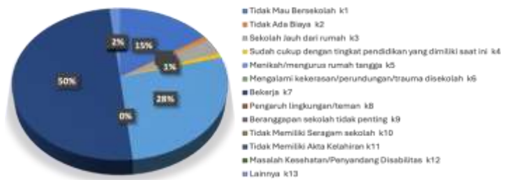
Data Anak Tidak Sekolah Berdasarkan Hasil Verifikasi Wilayah Individu Peserta Didik

Berdasarkan hasil verifikasi terkait data anak tidak sekolah diatas teridentifikasi bahwa anak tidak se- kolah disebabkan oleh berbagai macam faktor yang telah dikelompokkan menjadi 13 Faktor penyebab anak tidak sekolah. Dapat dilihat sebanyak 50% anak dengan usia peserta didik di Kalimantan Utara (Provinsi, Kabupaten/Kota) lebih memilih bekerja daripada bersekolah.