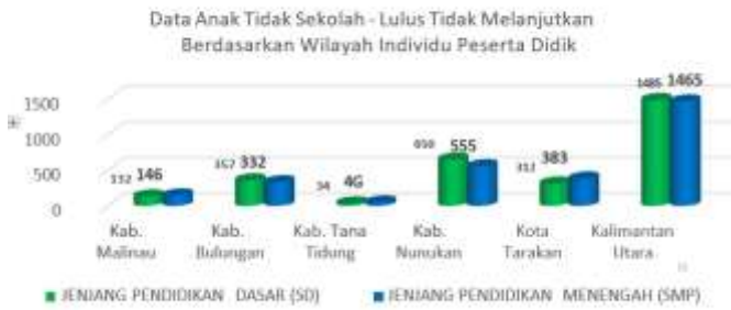
Tabel 3. Data Anak Sekolah Verifikasi Validasi Lulus Tidak Melanjutkan Berdasarkan Wilayah Individu Peserta Didik